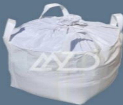
پوشش بالا ۴ دسته‌ای پایین صاف top cover skirt 4 loops flat bottom