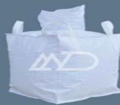
دهانه پرکننده بالا ۴ دسته‌ای top filling spout 4 loops