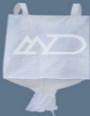
بالا كاملا باز ۴ دسته‌ای با دهانه تخلیه top full open 4 loops with discharge spout