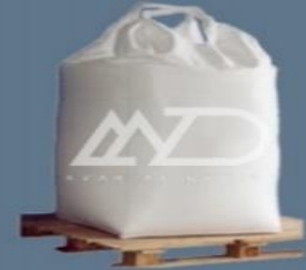
دو دسته double loops