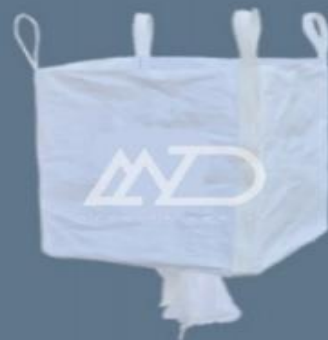
۴ دسته از ته متقاطع با دهانه تخلیه 4 loops cross bottom with discharge spout