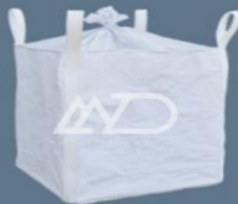
پوشش بالا ۴ دسته‌ای top cover skirt 4 loops cross bottom