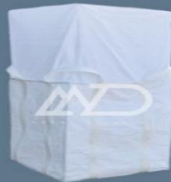
پوشش بالا ۴ دسته‌ای با کف # شکل top cover skirt 4 loops # shape bottom