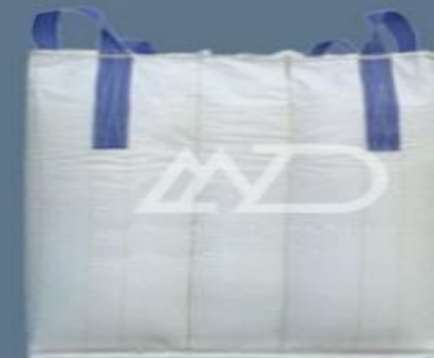
کیسه بافل baffle bag