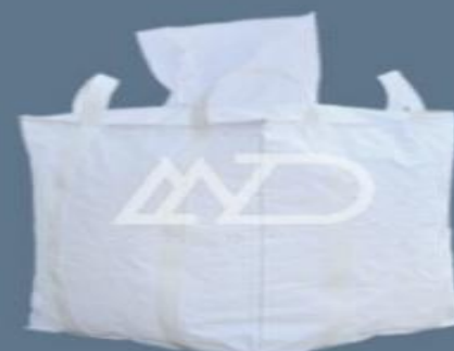
دهانه پرکننده کف # شکل top filling spout # shape bottom