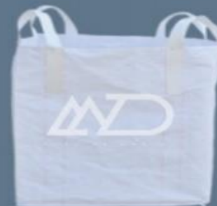
بالا کامل باز ۴ دسته‌ای کف صاف top full open 4 loops flat bottom