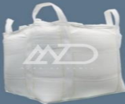
بالا كاملا باز کف # شکل top full open # shape bottom