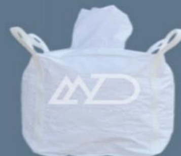
دهانه پرکننده بالا ۴ دسته‌ای متقاطع top filling spout 4 loops cross bottom