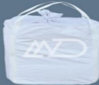
پوشش بالا دو دسته ای top cover skirt two loops cross bottom