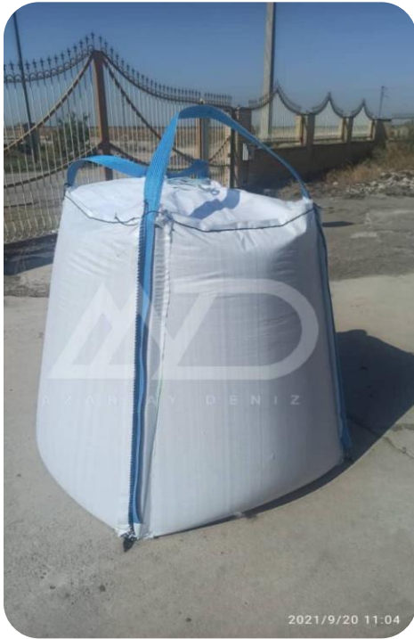
کیسه جامبو ذوزنقه ای 1 تنی Trapezoidal jumbo bag 1 ton