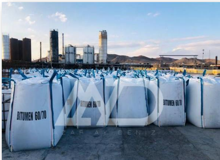
بیتوبگ 1300 کیلویی The 1,300-pound bitubag