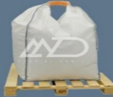
تک دسته single loop

بهترین دلیل برای استفاده از کیسه های اف ای بی سی مقاومت بالا و قابلیت استفاده مجدد و سایر ویژگی های مفید ، آن میباشد یک راه حل ایده آل برای حمل و نقل و ذخیره سازی انواع املاح و مواد شیمیایی و ... بسته به طراحی کرد در FIBC درخواست یانیاهاى مشتری می توان کیسه های اشکال و اندازه های مختلف کیسه ها می توانند مقاومت کششی فوق العاده ای را تحمل کنند