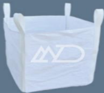
بالا کامل باز ۴ دسته‌ای top full open 4 loops cross bottom