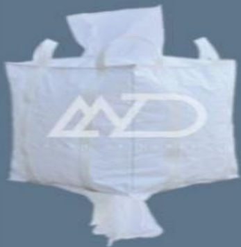
دهانه پرکننده # شکل با دهانه تخلیه top filling spout # shape bottom with discharge spout