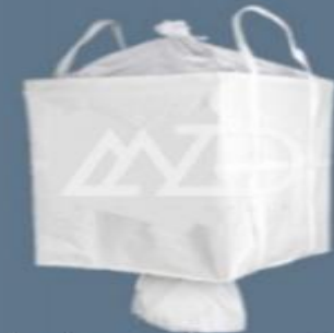
پوشش بالا دو دسته ای متقاطع پایین با دهانه تخلیه top cover skirt two loops cross bottom with discharge spout