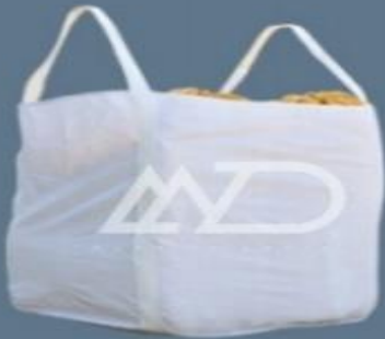
بالا کامل باز دو دسته ای top full open two loops cross bottom