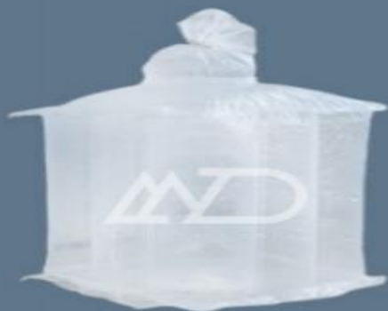
پی‌ای لایندر pe liner

The best reason to use FIBC bags is high resistance and reusability and other useful features. An ideal solution for transporting and storing a variety of salts and chemicals and ... Depending on the request or Customer needs FIBC bags can be designed in various shapes and sizes. Bags can withstand extraordinary tensile strength.