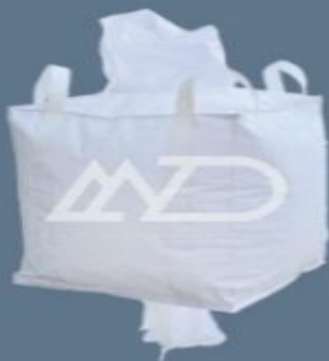
پوشش بالا دهانه پرکننده با کف صاف و دهانه تخلیه loops top filling spout flat bottom with discharge spout