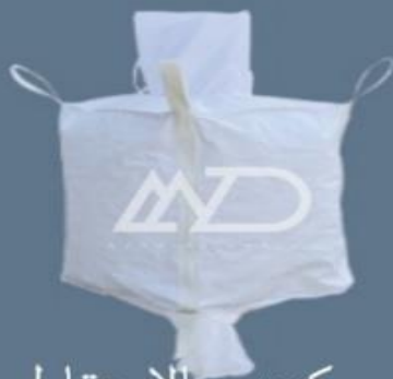
دهانه پرکننده بالا متقاطع پایین با دهانه تخلیه ۴ دسته‌ای top filling spout cross bottom with discharge spout